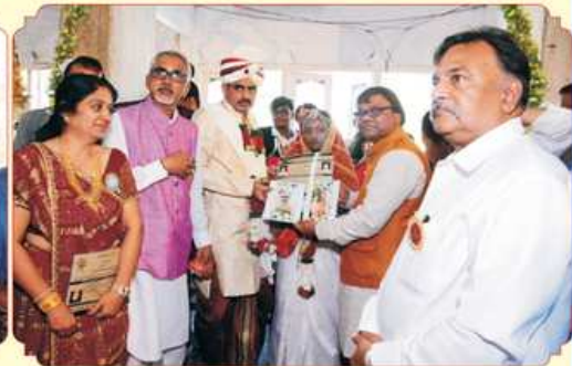
कन्यादान करता महाजनना प्रमुजश्री