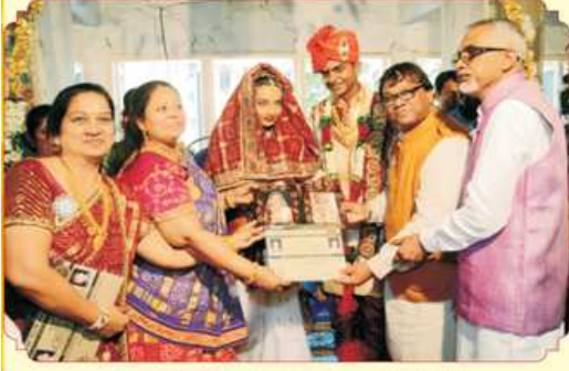
કન્યાદાન કરતા મહાજનના પ્રમુખશ્રી