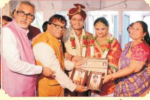
કન્યાદાન કરતા મહાજનના પ્રમુખશ્રી