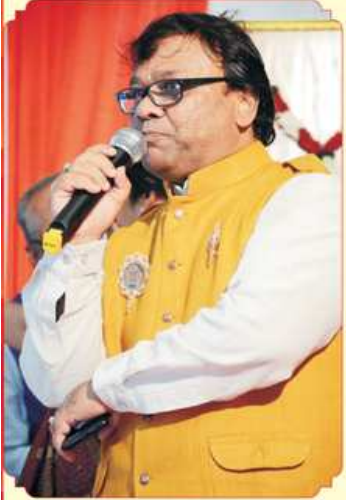
સંબોધન કરતાં મહાજનના પ્રમુખશ્રી