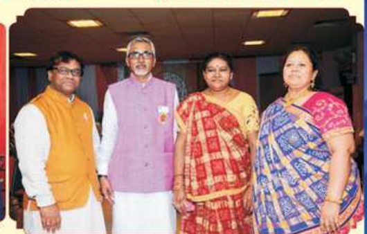
પ્રમુખશ્રી અને કન્વીનરશ્રી પરિવાર સાથે