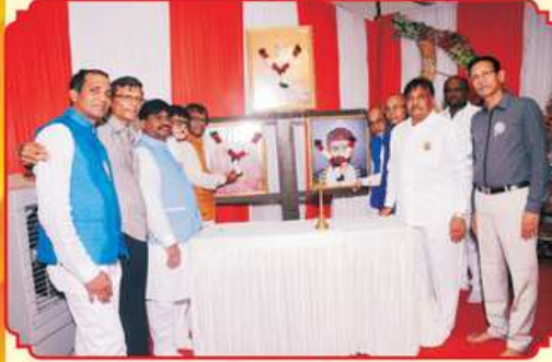
मुंजध महाजनना अधिकारीओ द्वारा दीप प्रागट्य