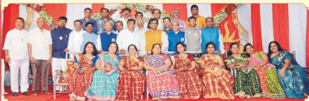
શ્રી ક.દ.ઓ. જૈન જ્ઞાતિ મહાજન - મુંબઈની સંયોજક ટીમ