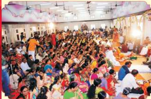
समूहलग्न विधि निहाणता स्वजनो सह ज्ञातिजनो