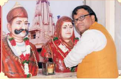
शेठश्री नरशी नाथाने भाणारोपश