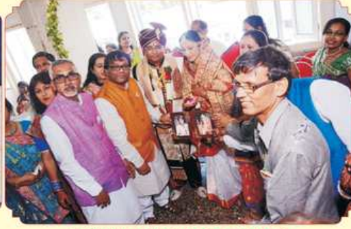
કન્યાદાન કરતા મહાજનના પ્રમુખશ્રી