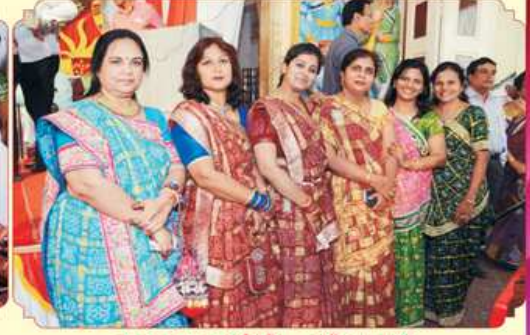
સમૂહ લગ્ન સમિતિ - મહિલા પાંખ