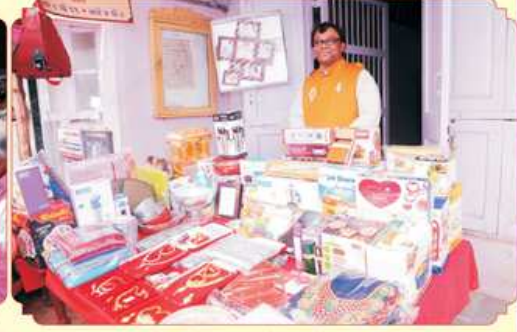
दायजा साथे प्रमुजश्री कल्पेशभाध मोता