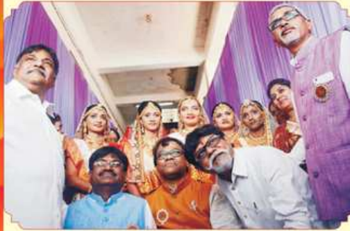
कन्याओ साथे महाजनना पदाधिकारीओ