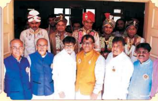
वरराजओ साथे महाजनना पदाधिकारीओ