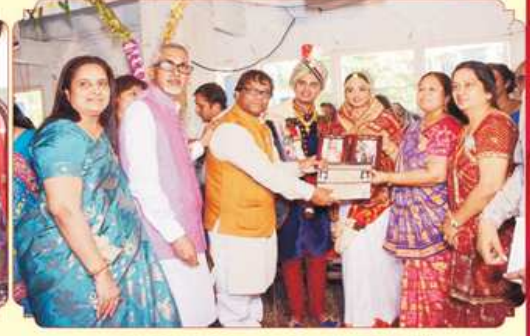
કન્યાદાન કરતા મહાજનના પ્રમુખશ્રી